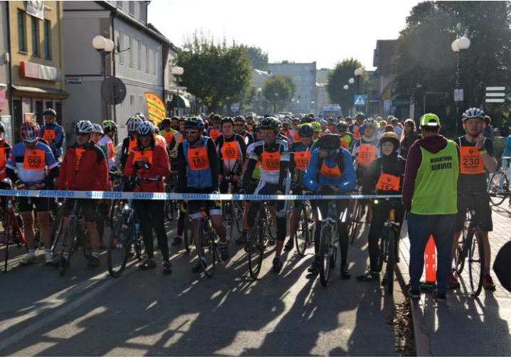
Zuławy Wikoło 2016