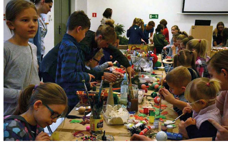
Fabryka Ozdób Choinkowych