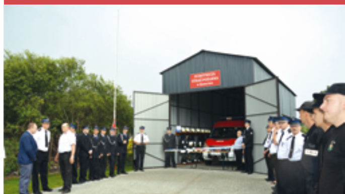
Budowa garażu dla OSP Kmiecin