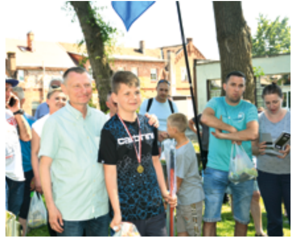
Zawody wędkarskie dla dzieci