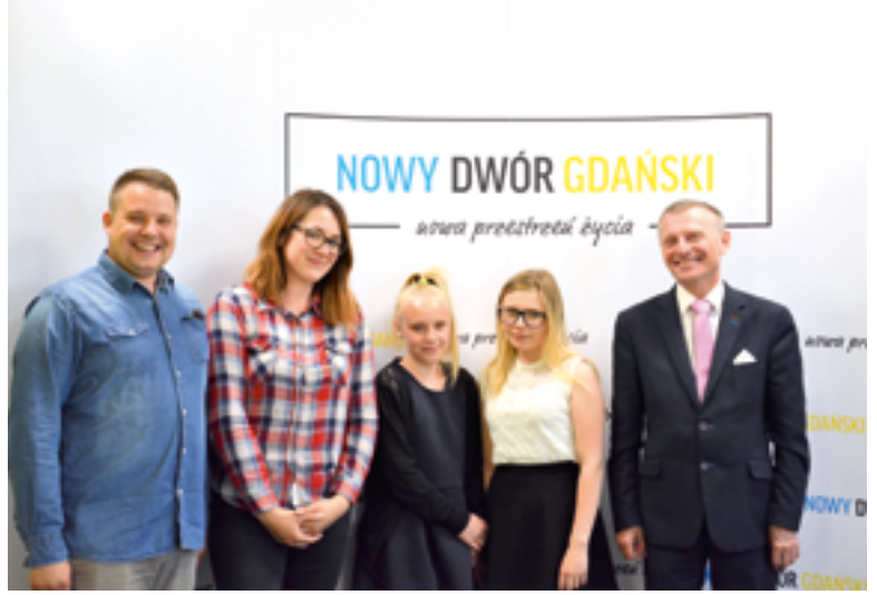
Wizyta podopiecznych z Domu dla Dzieci