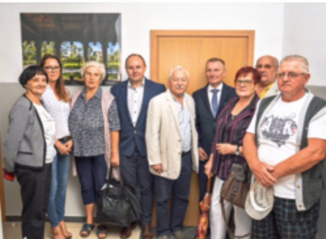
Przekazanie biura dla Związku Niewidomych