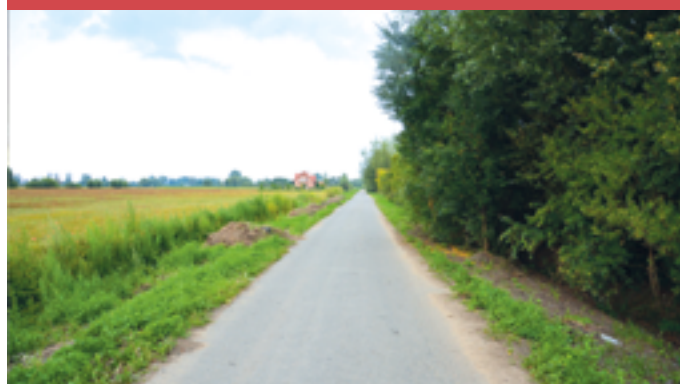
Remont drogi w Powalinie