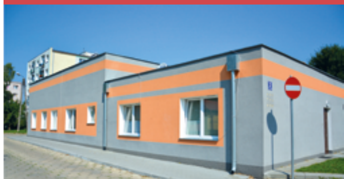
Budowa mieszkań przy ul. Tuwima