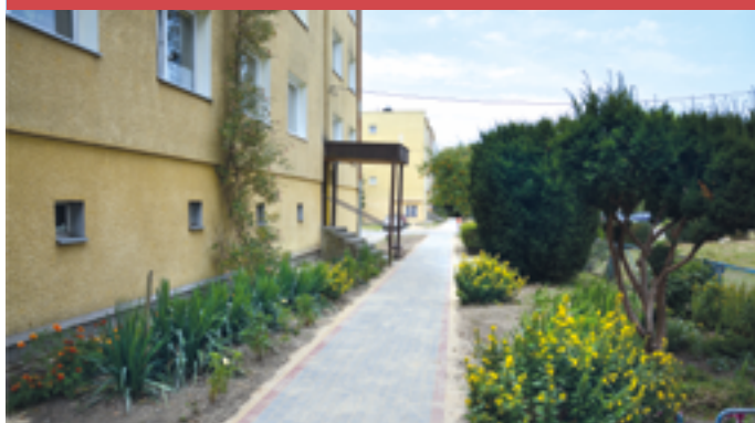
Budowa chodników w Kmiecinie