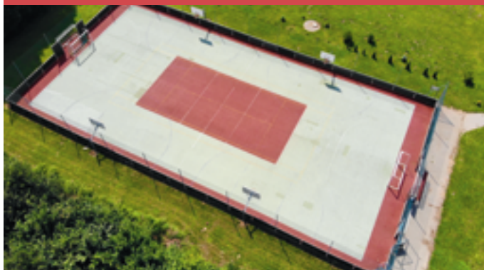
Budowa Boiska w Lubieszewie