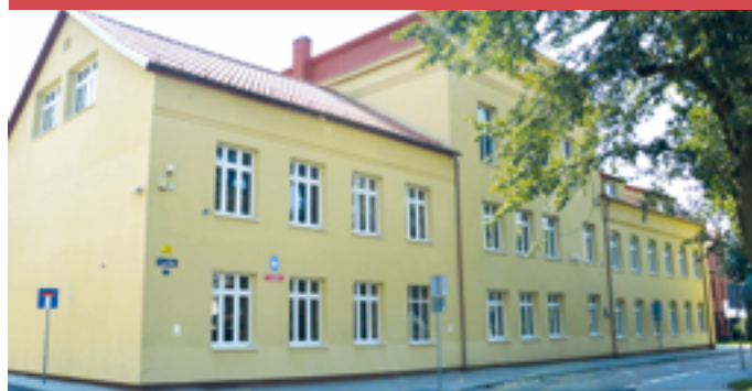
Termomodernizacja Szkoły Podstawowej nr 1