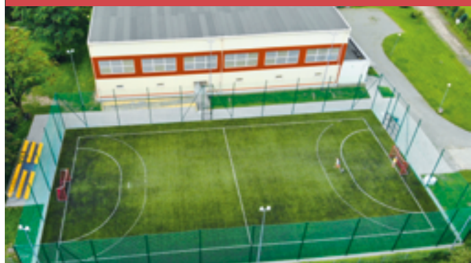
Budowa boiska w Marzęcinie