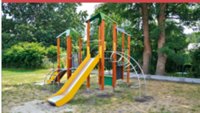
Budowa placu zabaw przy SP1