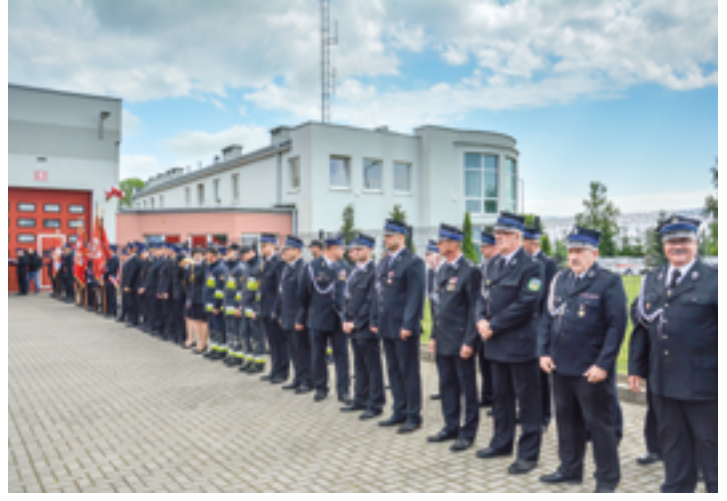
Obchody Dnia Strazaka