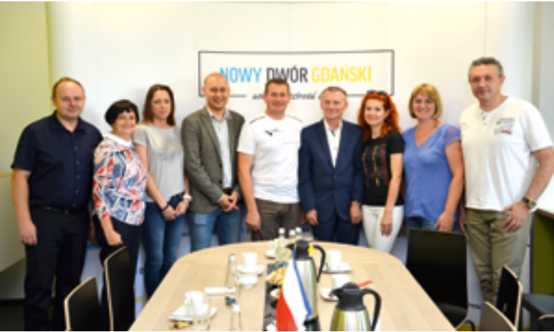
Wizyta przyjaciół z Sarn, Ukraina