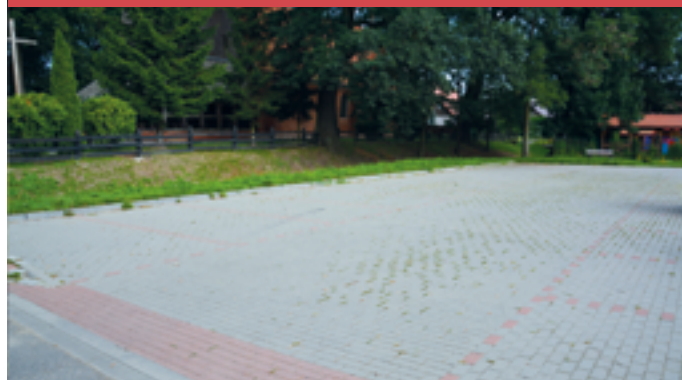
Budowa parkingu w Kmiecinie