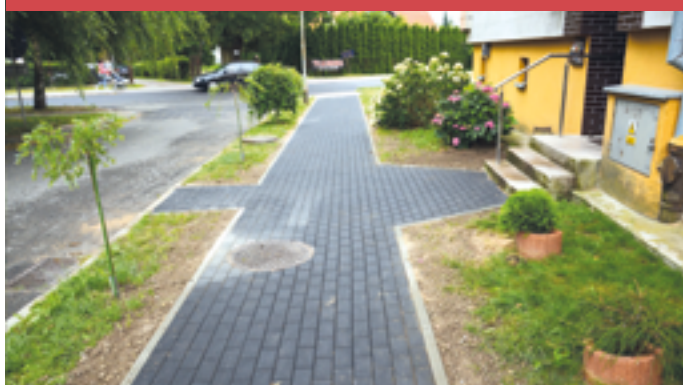
Przebudowa chodnika przy Warszawskiej 11-13