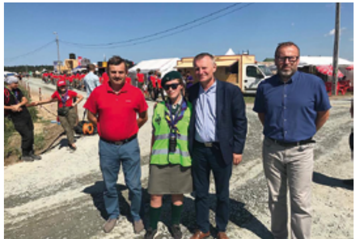
Zlot ZHP na Wyspie Sobieszewskiej