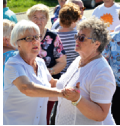
Zabawa Seniorów w Ostonce