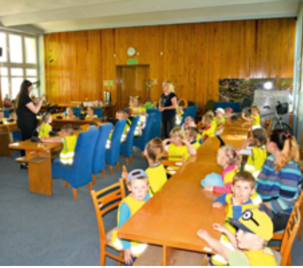
Przedszkolaki w UM